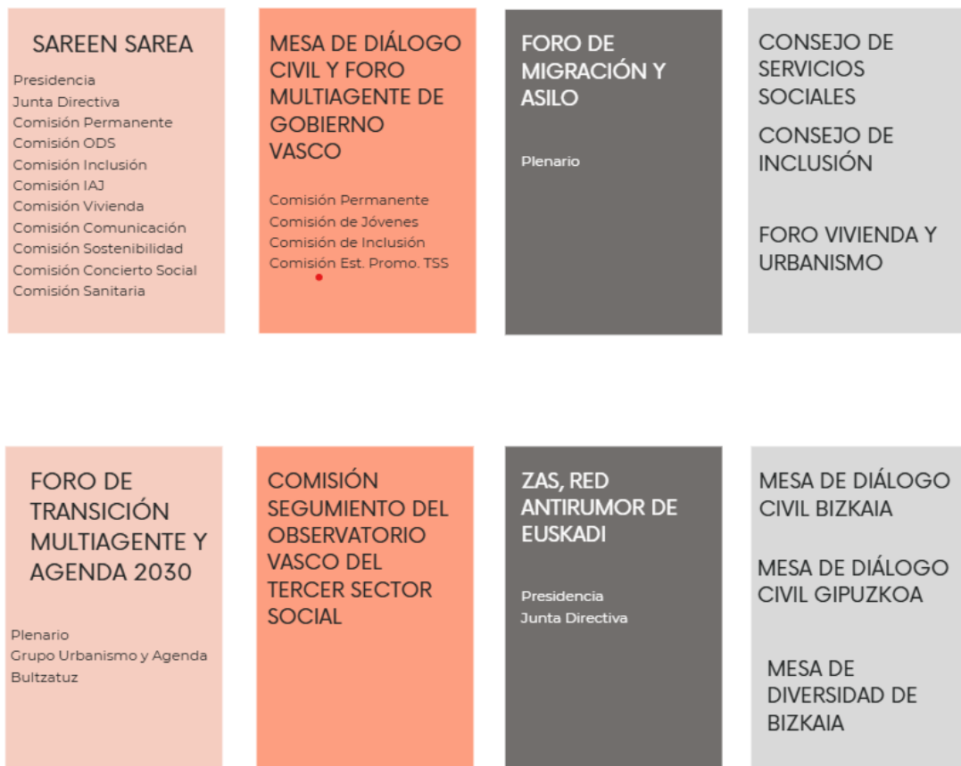
Gráfico resumido de los espacios de participación de Harresiak Apurtuz

El impulso de políticas inclusivas se canaliza a través de la participación en espacios de gobernanza, y la gestión de relaciones institucionales. Estos espacios pueden ser de carácter autonómico pero también circunscribirse a territorios concretos de la CAPV tanto a nivel local como foral.