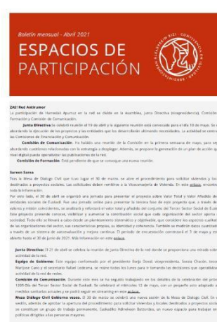
Imágenes de algunas páginas del Boletín del mes de abril

En relación con las comisiones de trabajo, funcionan con normalidad la Comisión de Jóvenes y la Comisión de Trabajo relativa al tema de la Vivienda en Gasteiz. Ambas comisiones están siendo muy activas y trabajan intensamente en canalizar las demandas de las entidades que conforman estas comisiones.