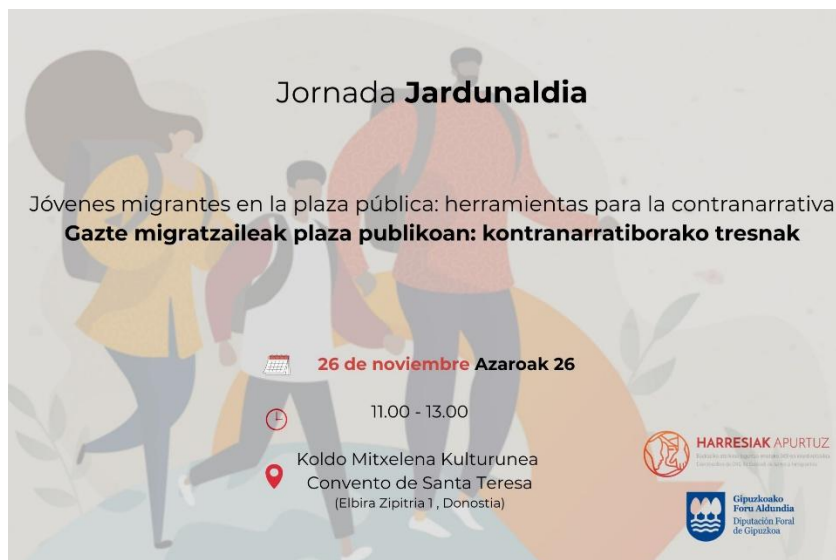
Cartel y programa de la jornada

De esta manera, se llevó a cabo la difusión a través de las redes sociales de Harresiak Apurtuz, se enviaron mails a toda la lista de contactos de la coordinadora, y pedimos a las entidades con las que la coordinadora trabaja de manera más estrecha la difusión entre los/as propias/os jóvenes con los/as que trabajan y otras entidades sociales.