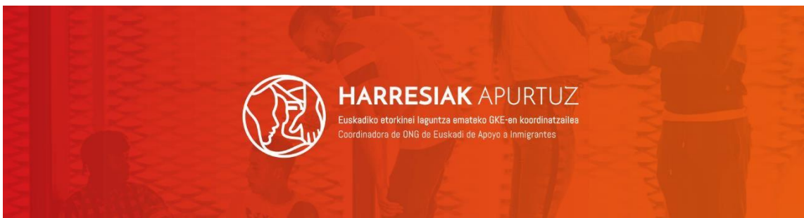
Imagen de la cabecera del boletín informativo con la imagen corporativa

Se trata de la herramienta comunicativa mejor valorada por las organizaciones y así lo hacen saber a través del teléfono, el correo electrónico o de manera presencial en las propias asambleas y/o en los grupos de trabajo.