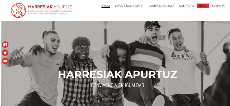
Imagen de la cabecera de la web

La página web continúa siendo una herramienta de comunicación corporativa clave en el marco a la hora de difundir el trabajo que lleva a cabo la Coordinadora. Desde que se contabilizan los datos a través de Google Analytics , esto es desde el 1 de enero de 2024, la página web ha sido visitada hasta el 31 de diciembre de 2024 por 1.297 personas. En los primeros meses del año 2025 se procederá a realizar una auditoría de la página con el objetivo de realizar mejoras en ella y de actualizarla en función a realidades comunicativas de la Coordinadora que fluctúan y son muy cambiantes.