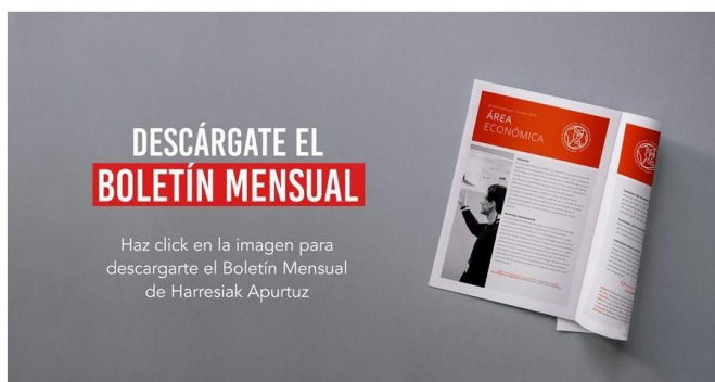
Espacio del "Boletín Informativo" para descargarse el informe de actividades del mes

En 2019, se desarrolló un potente trabajo de conceptualización con el objetivo de reforzar y/o activar el compromiso de las entidades sociales con Harresiak Apurtuz. Este trabajo se desarrolló, fundamentalmente, en el segundo trimestre del año, habiéndose lanzado la campaña en el mes de octubre. Durante el 2025, se ha consolidado esta herramienta de comunicación interna #BaiNahiDut , un boletín mensual que contiene un apartado de descarga del informa de actividad de la Coordinadora correspondiente al mes anterior del envío. A día de hoy está muy bien valorado por las entidades y contiene todas y cada una de las claves del trabajo de Harresiak Apurtuz.