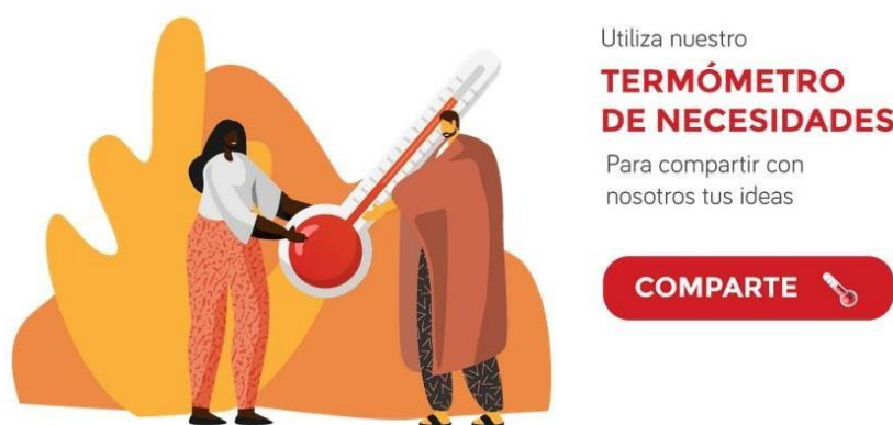
Ilustración generada para el “termómetro de necesidades”

Se incluye dentro del “Boletín informativo” y se trata de una ilustración que “invita” a las entidades sociales a contactar con Harresiak Apurtuz a través de sus diversos canales de comunicación para abordar problemáticas, situaciones o contextos que hayan identificado y que quieran que se trabajen de manera conjunta en el seno de la Coordinadora. Destacamos que a la hora de generar la imagen que ilustra el termómetro de necesidades, hemos seguido el principio de igualdad, usando imágenes no sexistas.