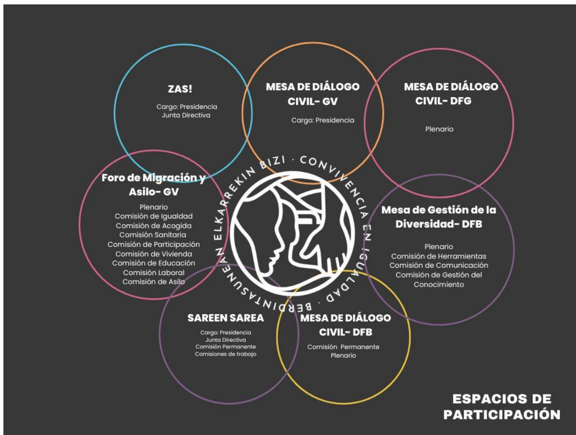
Gráfico resumido de los espacios de participación de Harresiak Apurtuz