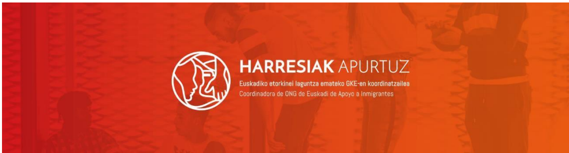
Imagen de la cabecera del boletín informativo con la imagen corporativa

Se trata de la herramienta comunicativa mejor valorada por las organizaciones y así lo hacen saber a través del teléfono, el correo electrónico o de manera presencial en las propias asambleas y/o en los grupos de trabajo.