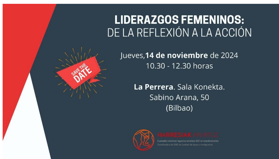
Cartel de difusión de la actividad

Para ello, se ha trabajado a partir de tres bloques que han ayudado a vehicular la conversación y la reflexión, esta vez y a diferencia del encuentro del pasado año, centrándonos en las diferentes estrategias que las mujeres ponen en marcha desde su espacio profesional para garantizar estructuras, prácticas y dinámicas más feministas, justas y horizontales. Se ha tratado, por tanto, de generar un espacio que hadado un paso más en la reflexión iniciada el pasado año, la cual se quedó en visibilizar e identificar las diferencias entre los liderazgos feministas y los que no lo son, y las dificultades y retos comunes que las mujeres encontraban en el despliegue de este tipo de estilos de liderazgo.