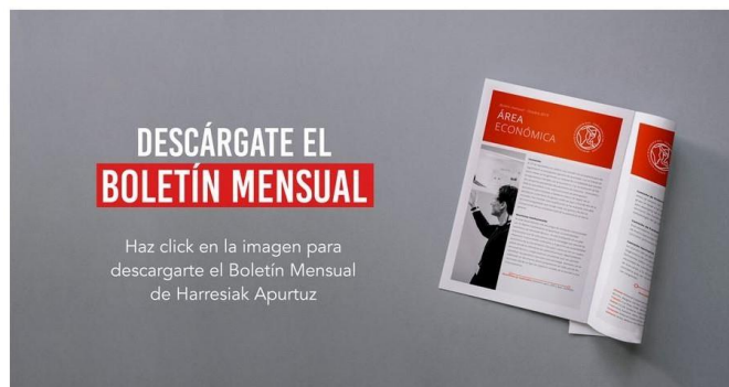
Espacio del "Boletín Informativo" para descargarse el informe de actividades del mes

En 2019, se desarrolló un potente trabajo de conceptualización con el objetivo de reforzar y/o activar el compromiso de las entidades sociales con Harresiak Apurtuz. Este trabajo se desarrolló, fundamentalmente, en el segundo trimestre del año, habiéndose lanzado la campaña en el mes de octubre. Durante el 2024, se ha consolidado esta herramienta de comunicación interna #BaiNahiDut , un boletín mensual que contiene un apartado de descarga del informa de actividad de la Coordinadora correspondiente al mes anterior del envío. A día de hoy está muy bien valorado por las entidades y contiene todas y cada una de las claves del trabajo de Harresiak Apurtuz.