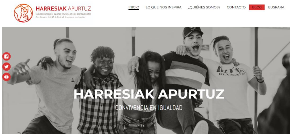
Imagen de la cabecera de la web

La página web continúa siendo una herramienta de comunicación corporativa clave en el marco a la hora de difundir el trabajo que lleva a cabo la Coordinadora. Desde que se contabilizan los datos a través de Google Analytics , esto es desde el 1 de enero de 2024, la página web ha sido visitada hasta el 31 de diciembre de 2024 por 1.297 personas. En los primeros meses del año 2025 se procederá a realizar una auditoría de la página con el objetivo de realizar mejoras en ella y de actualizarla en función a realidades comunicativas de la Coordinadora que fluctúan y son muy cambiantes.